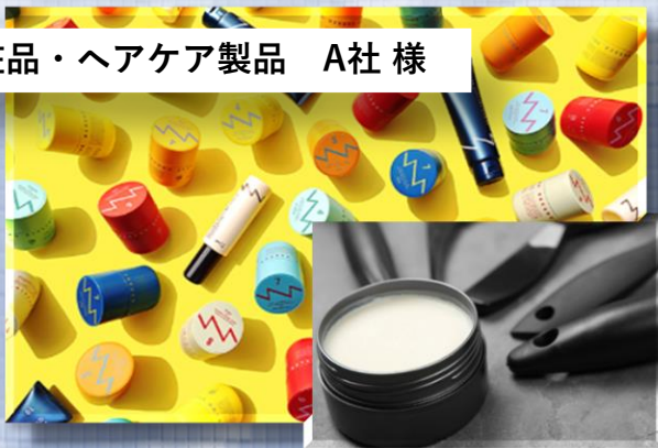
化粧品・ヘアケア製品 A社様

2024年ヒット商品連発と卸先の拡大によって、入出荷量が前年比で150%に急増しましたが、お客様との定期的なミーティング開催と、各種傾向値より物量の予測を行い、作業体制の改善を進めて作業簡素化を当社より提案。その後、出荷量が急増した日でも当日出荷を実現。併せて物流コストの上昇率を120%に抑えることに成功しました。