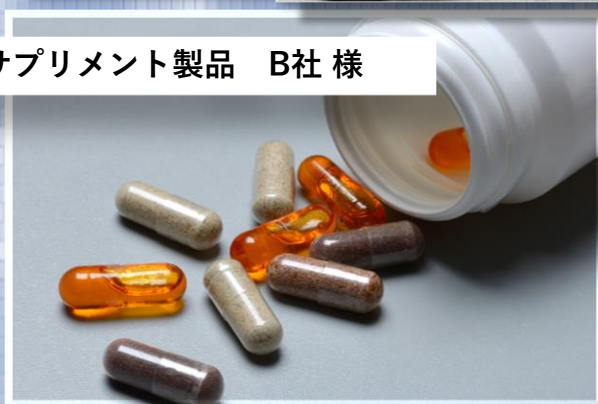
サプリメント製品 B社様

お客様の事業計画より、海外卸を展開する情報を事前にキャッチし当社で最適な輸出業者の選定を行いご提案。結果、輸出コストをお客様想定より30%ダウンを可能にしました。 また、輸出開始以降は、貿易関連の書類作成等のサポートも行い、お客様の事務作業負荷の軽減も実現しています。